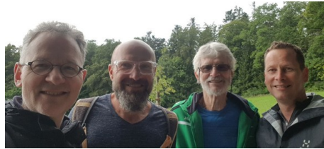
Wandergruppe auf dem Täuferweg

«Espresso» ist ein Kafi für Männer – das normalerweise in den Räumen der Kirchgemeinde im Adler stattfindet. Anfangs August jedoch tranken wir den Kaffee ausnahmsweise in Hemmental.