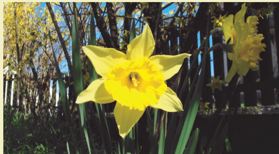
Gottes Liebe macht Neuanfänge möglich und lässt uns aufblühen