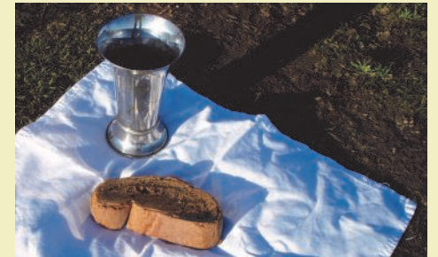
Brot und Wein – Zeichen der Befreiung.

Während sie miteinander essen, nimmt Jesus Brot, dankt Gott dafür, bricht es, gibt es ihnen und sagt: «Nehmt, esst! Dieses gebrochene und verteilte Brot weist darauf hin, dass ich mein Leben hingebe für euch.» Dann nimmt er den Kelch mit dem Wein, dankt Gott dafür und sagt: «Trinkt alle daraus! Dieser Kelch weist darauf hin, dass mein Blut für alle Menschen vergossen wird zur Vergebung der Schuld.» Schliesslich sagt er: «Teilt immer wieder Brot und Wein miteinander, damit unter euch gegenwärtig ist, was ich für euch tue!»