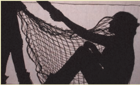
Den Menschen Gottes Liebe zeigen.

Gesagt, getan. Aller Erfahrung zum Trotz füllen sich die Netze. Simon kann es kaum fassen. Erschrocken denkt er: «Da muss Gott mit im Spiel sein. Es ist, wie wenn Gott selbst in diesem Jesus da ist.» Mit einem Mal werden ihm seine Fehler, sein Versagen, seine Schuld bewusst. Simon wirft sich vor Jesus nieder und bittet ihn: «Herr, geh fort von mir! Ich bin ein sündiger Mensch!» Doch Jesus sagt zu ihm: «Hab keine Angst! Von jetzt an wirst du mir helfen, den Menschen zu zeigen, dass Gott sie liebt!»