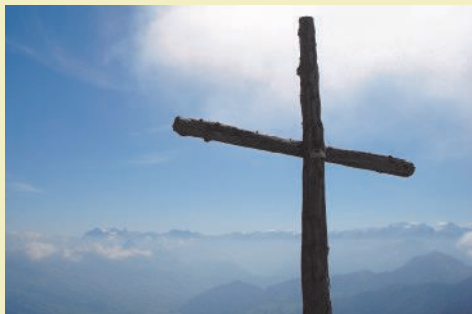
Das Gipfelkreuz erinnert an das Christuskreuz.

An der Richtstätte Golgatha nageln die römischen Soldaten Jesus ans Kreuz. Er sagt: «Vater, vergib ihnen! Denn sie wissen nicht, was sie tun.» Schliesslich stirbt Jesus mit den Worten: «Vater, ich gebe mein Leben in deine Hände!»