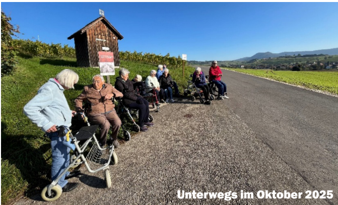
Unterwegs im Oktober 2025