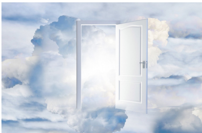
Eine ökumenische Initiative der Hallauer Kirchen zum Herbstfest 2024