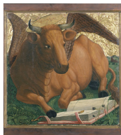
Bild: Evangelistensymbol Stier, Michael Pacher (Umkreis), Thomas Becket-Altar, um 1470/80

Dienstagabend, von 19.30 bis 20.30 Uhr, 20. Juni.