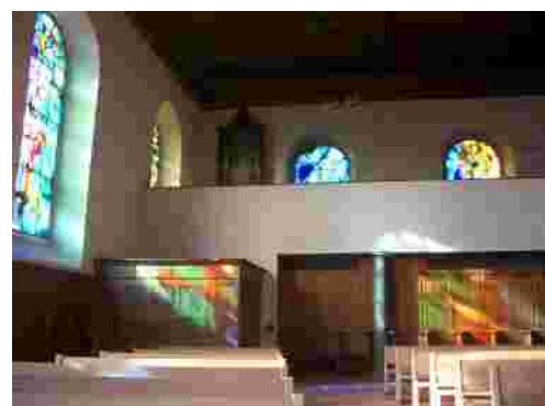
Windfang und Säule, Westempore