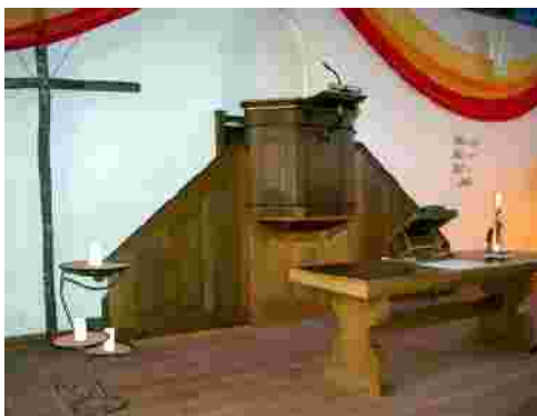
Kanzel und Altartisch, Ostempore