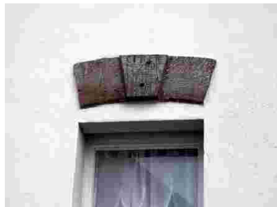
Rest des Scheunenbogens

Das Pfarrhaus befindet sich etwa 300 m westlich der Kirche an der Kreuzung Kirchstrasse/Neunkircherstrasse, gegenüber dem VOLG-Laden.