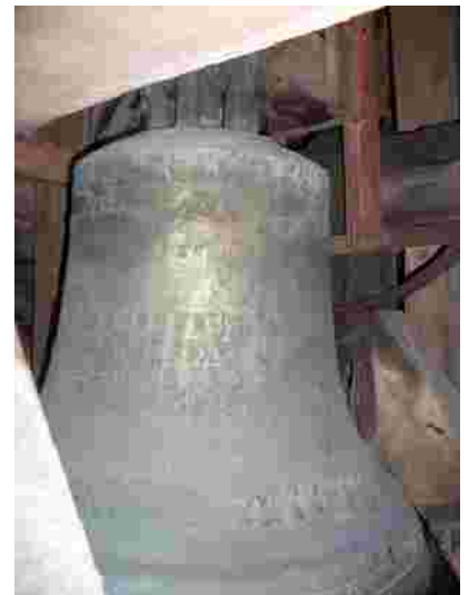
Die zweitgrösste Glocke