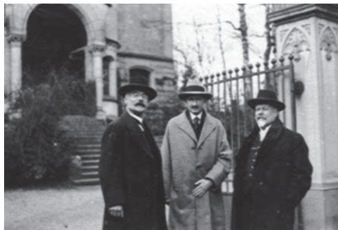
Pasteurs de jadis...