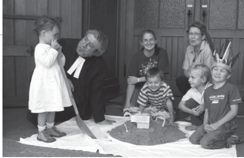
«Il était une foi»