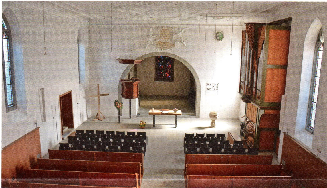
Innenansicht der Kirche von Thayngen. Nach dem Brand von 1499 mussten die Thaynger den Wiederaufbau fast alleine berappen. Auch sonst erhielten sie kaum Unterstützung aus Konstanz.

Ursache des Zehntstreits war die Tatsache, dass das Konstanzer Domkapitel die Gemeinde Thayngen ziemlich vernachlässigte. Als Inhaber des Patronatsrechtes hatte es nicht nur das Recht, den Pfarrer zu bestimmen, es hatte eigentlich auch die Pflicht, für den Unterhalt des Pfarrers und der Kirchenbauten zu sorgen. Vieles davon wurde aber von der Gemeinde selbst getragen. So wurde der Hilfspriester von einer gemeindeeigenen Stiftung bezahlt. Wenig später mussten die Thaynger selbst für eine neue Glocke sorgen, und sogar der Priester musste für vorgeschriebene Gebete an speziellen Tagen im Kirchenjahr aus eigenen Mitteln be-