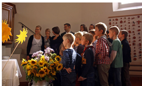
Erntedank in Trasadingen