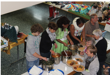
Fassstelle für Injeras und Hörnli