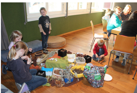
Die Bastelecke für die Kinder