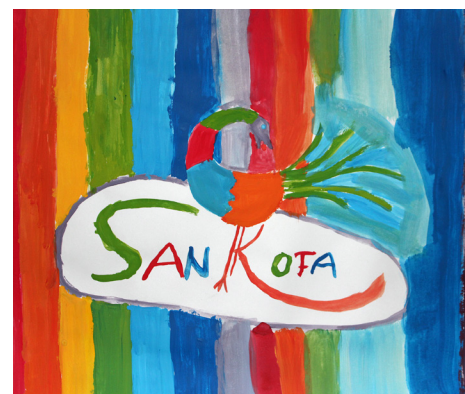
Bild aus der Malecke des Basars. Der Sankofa-Vogel ist ein Symbol, der für das Lernen aus der Vergangenheit für eine bessere Zukunft steht.

Im vergangenen Jahr wurden fürs Blettli von „mission 21“ (4 Nummern pro Jahr) total 2545.00 Fr. an die „mission 21“ in Basel einbezahlt. Drei Frauen zogen das Geld ein, eine vierte Frau half beim Verteilen der 58 Blettli. Ihnen wie auch den Spenderinnen und Spendern sei herzlich gedankt.