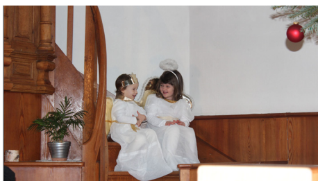
Weihnachtsfeier Osterfingen. Die Engel unter sich