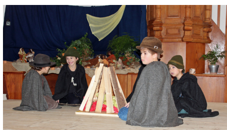
...und die erwartungsvollen, frohen Hirten