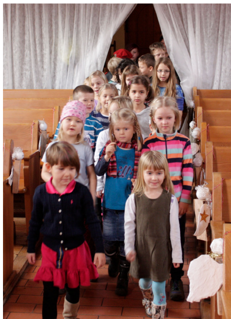
Hauptprobe Kolibriweihnacht Trasadingen. Vom Einzug bis zum Schlussbild klappt alles tipp topp