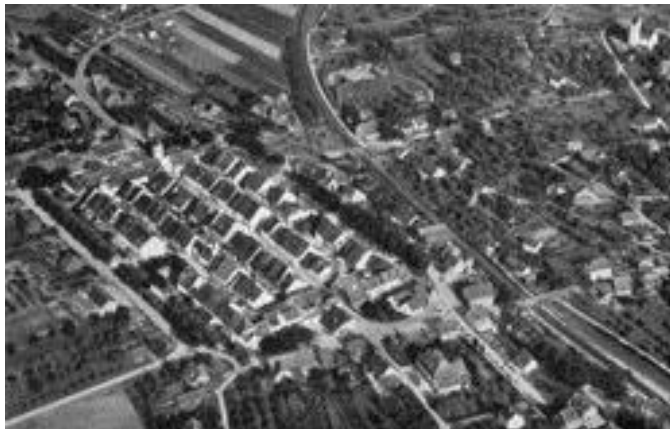
Luftbild von Neunkirch

1948: Transistor erfunden 1949: Pan Am führt Transatlantik Pas- sagierflüge ein 1949: Gründung der NATO, des Europa- rates, zweier Deut- scher Staaten und der Volksrepublik China